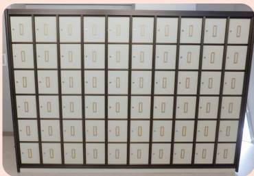
納骨堂(大分市営納骨堂)

現在、アンケート結果を集計しており、今後集計結果をホームページにて公表する予定です。