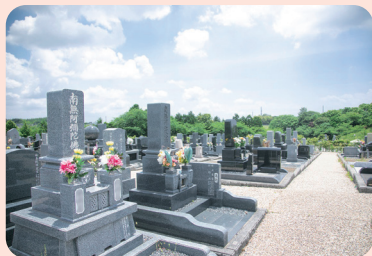
区画墓地(知北霊園)