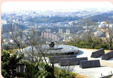
合葬墓地(高槻市公園墓地)